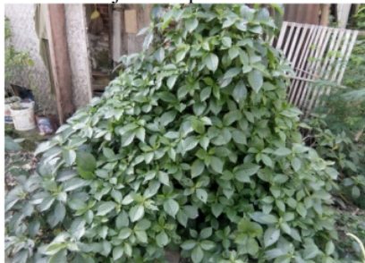
Gambar. 1. Keji beling ( Strobilanthes crispus )

Sampel diambil dari daun tanaman Strobilanthes crispus (kejibeling) di desa Sidorejo Kabupaten Madiun.